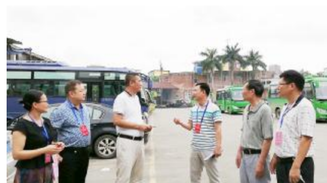
人大代表到安铺车站深入调研

发展特色小镇，涵盖内容丰富多元，最核心的是产业。各级人大代表紧盯安铺的产业定位，认为要从特色小镇推进城镇化发展的全局出发，进一步寻求破解经济发展瓶颈、创新发展动能，加快产业转型升级等难题。同时建议因地制宜，大力推动食品加工、木制品家具、造纸等传统产业升级改造，培育壮大现代物流、