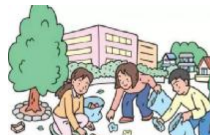
廉江市科学技术协会 供稿

近期，一项研究再度引发人们对于防晒剂成分进入血液循环的担忧。研究会入选 24 名健康志愿者连续 4 天每天涂抹 4 次防晒