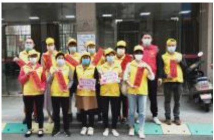
近日,团市委组织志愿者开展“为生命加油,为战‘疫’助力”无偿献血活动。