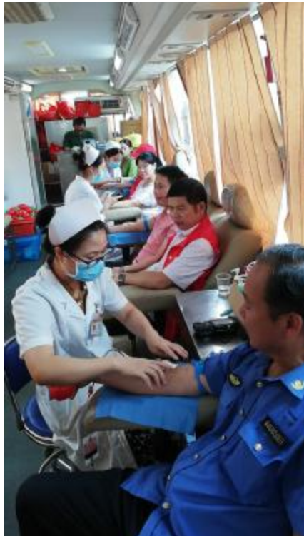
我市大力推进无偿献血工作,实现了全市临床用血100%来源于无偿献血的工作目标和100%满足全市临床用血需求的目标。(资料图片)