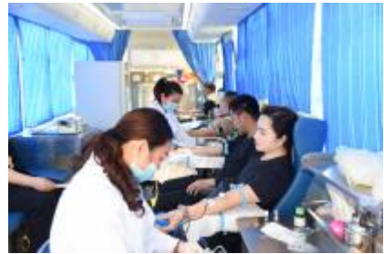
无偿献血最能体现无私奉献、相互帮助、共同战胜疾病的高尚人文精神。(资料图片)