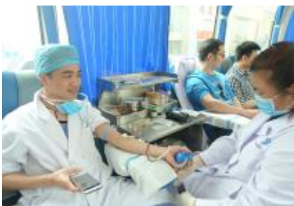
无偿献血志愿者无私的奉献,凝聚着湛江这座大爱之城温暖人心的力量。图为医务工作者用爱心献血方式践行医者仁心。(资料图片)