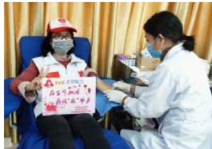
献出一份血,传递一份爱。