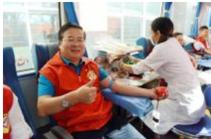
从1997年至2019年,我市累计有十几次积极参与无偿献血,生动诠释大爱无疆的精神。(资料图片)