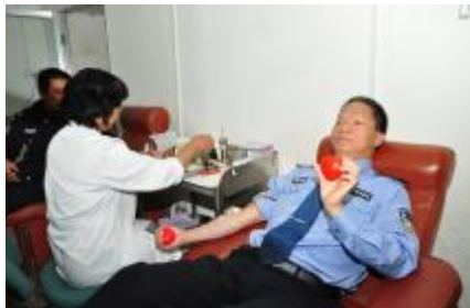
我健康,我献血,我快乐。长期以来,我市干部群众积极参与无偿献血,用实际行动展现勇担社会责任的良好精神风貌和热心公益事业的优良传统。(资料图片)