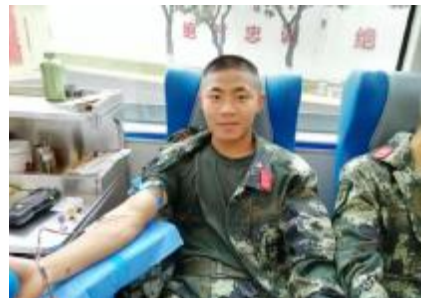
无偿献血,无私奉献。无偿献血志愿者表示,在无偿献血的过程中体会到奉献的快乐,今后将继续做这件如此有意义的事。(资料图片)